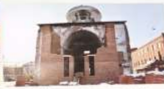
Март 2018 года. Возведены стены алтарной части, подведены инженерные коммуникации