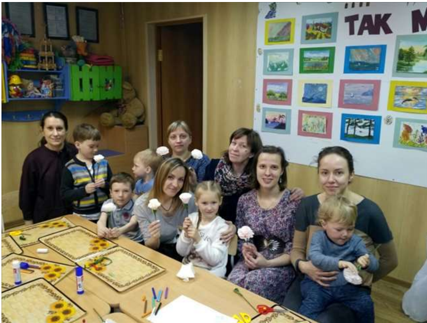
Дни Белого цветка с приходскими семьями