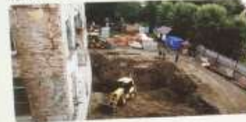
Май 2017 года. Начало строительства