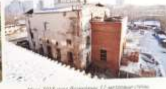
Май 2018 года. Возведены 12 метровые стены. Начал сбор средств на 4-й колокол