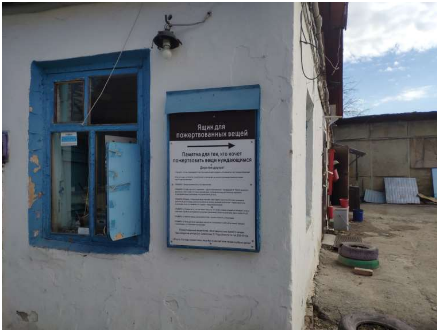
Указатель и памятка для тех, кто хочет пожертвовать вещи