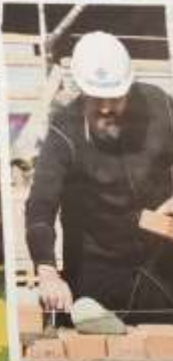
Публикация в бесплатной районной газете