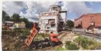
Июнь 2017 года. Начало строительства